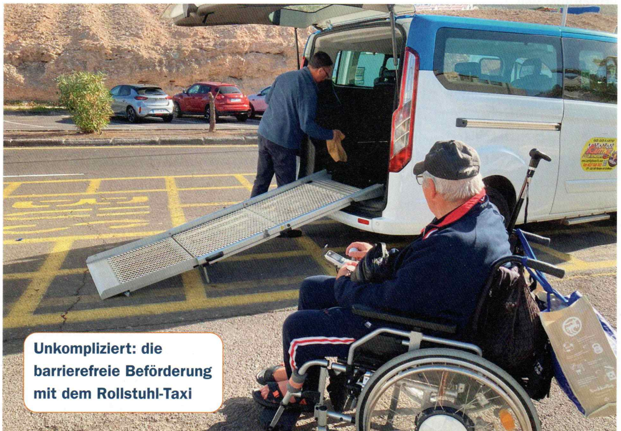
Unkompliziert: die barrierefreie Beförderung mit dem Rollstuhl-Taxi

Ganz wichtig war es den Rollstuhl mit Akku anzumelden.