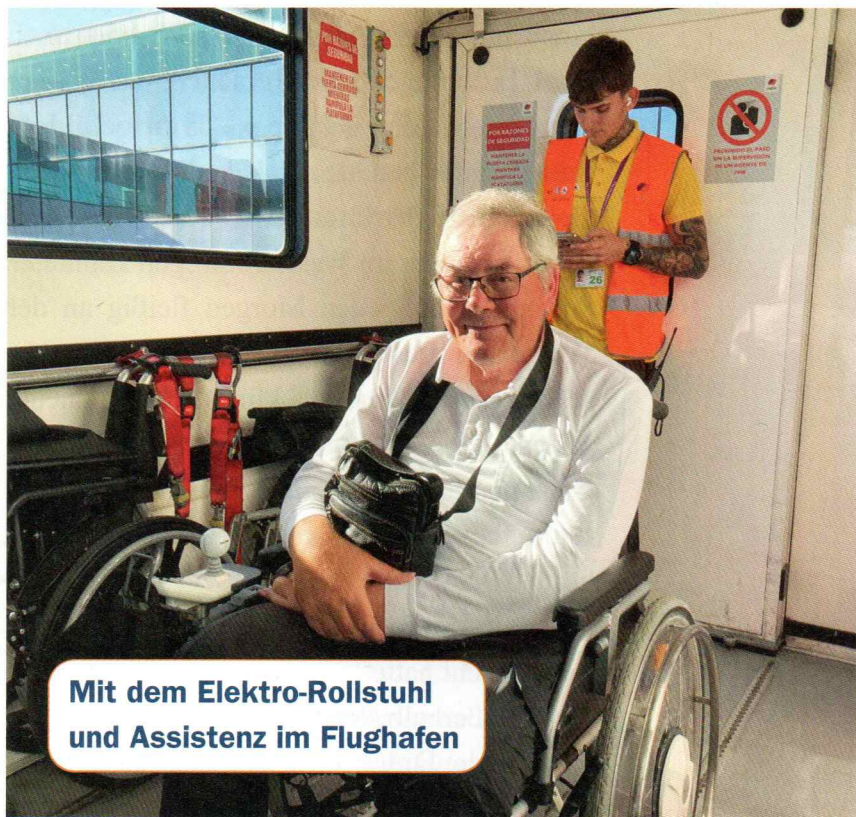
Mit dem Elektro-Rollstuhl und Assistenz im Flughafen